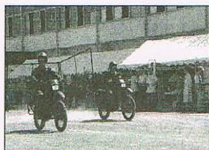
被害状況確認訓練