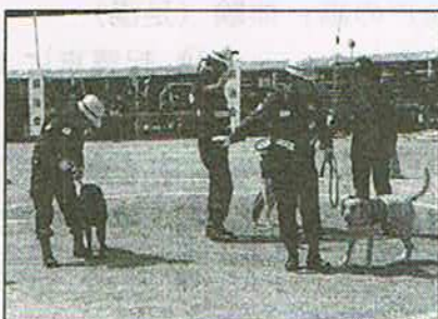
救助犬による被災者捜索訓練