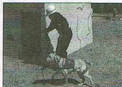
救助犬とのふれあい体験