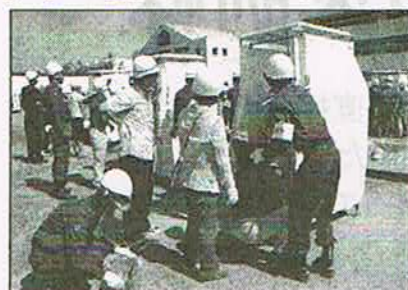
仮設トイレ組立訓練