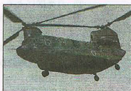
自衛隊による物資輸送訓練