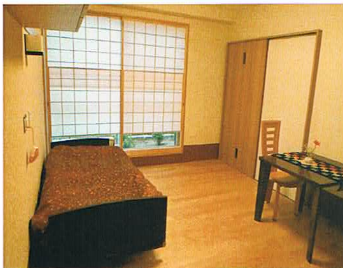
全室個室の居住スペース

「あずましさ」 ・ Amenity ・ Comfortable 当施設では、「あずましさ」（青森県の方言で「心地よい」「快適な」という意味）をキーワードに、ご利用者の尊厳を尊重したケアを提供して参ります。