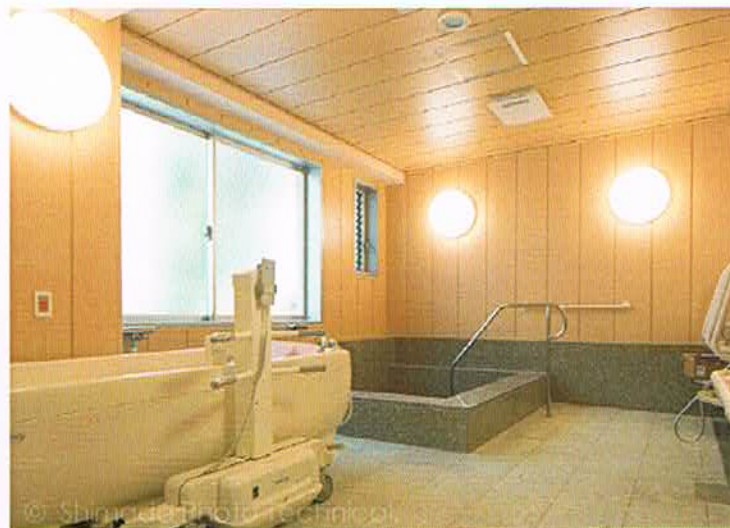
快適な広さの浴室（一般浴槽と特殊浴槽）