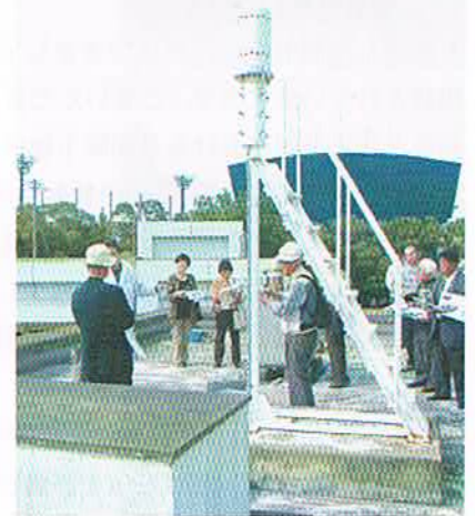
写真2 モニタリングポスト

環境研究センターの施設見学時には放射能測定棟も見学可能です。写真は放射能測定棟屋上にあるモニタリングポストを説明しているところです。