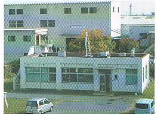
写真1 環境放射能測定棟