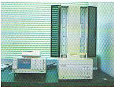
写真3 ベータ線測定装置

休日を除く毎日、決まった時刻に降水を採取し、写真3のベータ線測定装置で調査をしています。この調査は試料中の放射性核種を判別することはできませんが、ウラン標準線源などとの比較から、試料中の放射能のおおよそを簡易に、かつ、迅速に知ることができます。この調査の結果を基に、さらに核種分析などの精密な測定を行うべきかどうかや、法令などに規定された基準レベルを越えたかどうかを判断したり、環境中の放射能がどのように推移しているのかについても調査しております。