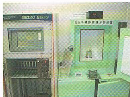
写真4 ゲルマニウム半導体核種分析装置

なお、①～③の調査の結果、1990年の調査開始以来、現在まで放射能の異常は観測されていません。