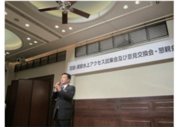
習志野市長もラブコールを