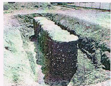
機械攪拌工法による改良体の掘り出し調査例