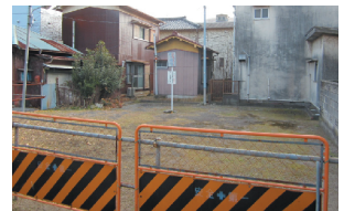
*③売却困難な防火用地も資産に含まれています